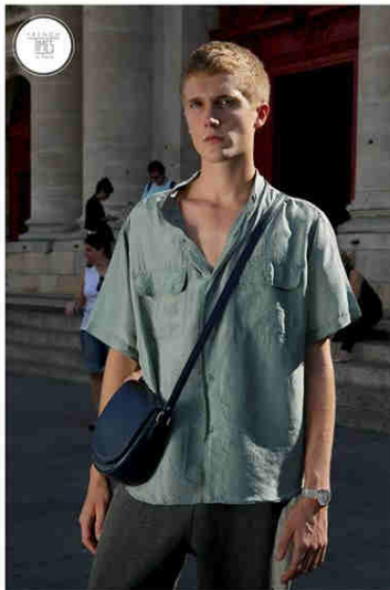
THOMAS Lip Dauphine timepiece.