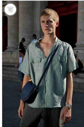
THOMAS Lip Dauphine timepiece.