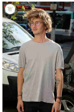
ROMAIN Trendy-Classic. Larsen.