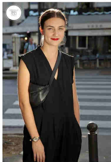
GLORIA Go Girl Only. Envole-moi.