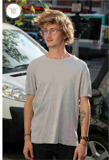
ROMAIN Trendy-Classic. Lansen.