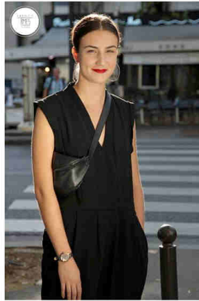
GLORIA Go Girl Only. Envole-moi.