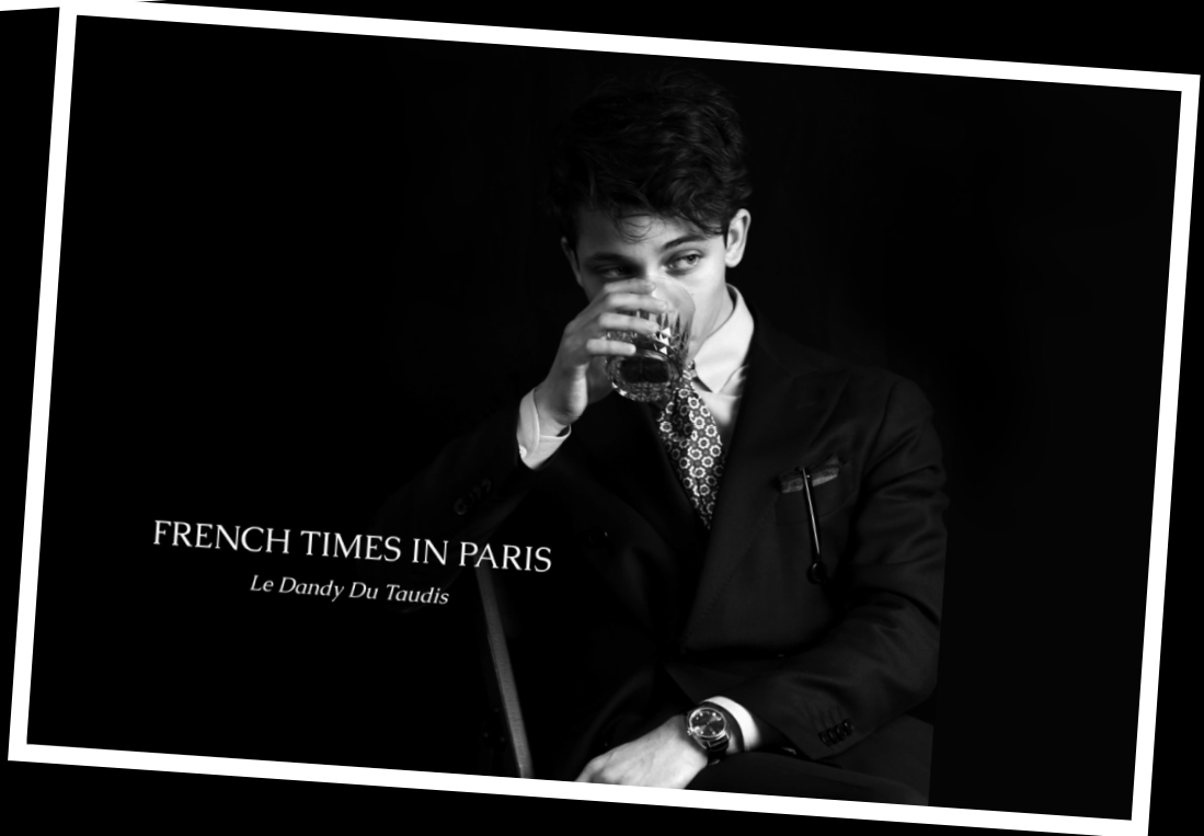
FRENCH TIMES IN PARIS Le Dandy Du Taudis